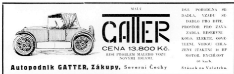
Reklama na malý Gatter z roku 1931

Willibald Gatter (nar. 1896), který pracoval i v automobilce Austro-Daimler, vybavil svůj malý automobil dvou-dobým vodou chlazeným jednoválcovým motorem o objemu 350 cm 3 a výkonu 6,6 kW (9 k). Typ motoru, řetězový sekundární převod a brzdy pouze na zadních kolech zařazovaly toto vozidlo mezi cyclecary. Jednodu-chá dvoumístná karoserie o rozměrech 2 500 x 1 100 x 1 400 mm, s jedním nouzovým sedadlem pro dítě, byla vybavena rovněž zavazadlovým prostorem a elektrickou instalací Bosch. W. Gatter podnikl s tímto automobi-lem propagační jízdu přes Alpy do Terstu a zpět přes Tatry. I přes nízkou cenu – 13 800 Kč – nebyl o tento cyclecar velký zájem. Proto V. Gatter na Pražském autosalonu v roce 1932 představil verzi se silnějším dvouvál-čovým motorem 448 cm 3 (vrtání x zdvih 90 x 70 mm) o výkonu 7,4 kW (10 k), elektrickým startérem a čtyř-místnou jednodveřovou karoserií, která byla prodlávana za 14 800 Kč. Výroba byla omezená, v roce 1933 bylo v ČR registrováno 46 vozidel této značky. W. Gatter odešel v roce 1936 do Německa.